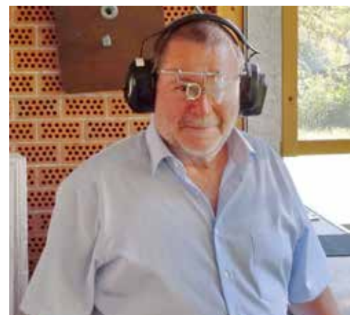
Der Schützenmeister im 50m-Stand

Im Übrigen verlief der Anlass reibungslos. Unser Schützenmeister Pe-