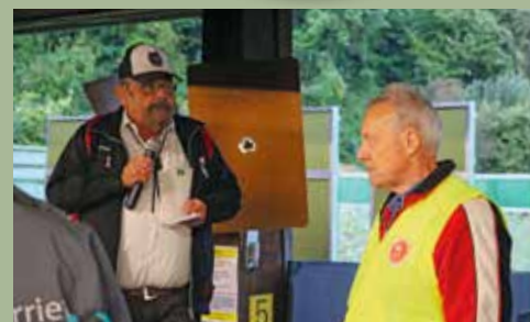
SG Eröffnung des Finals St. Gallen 16