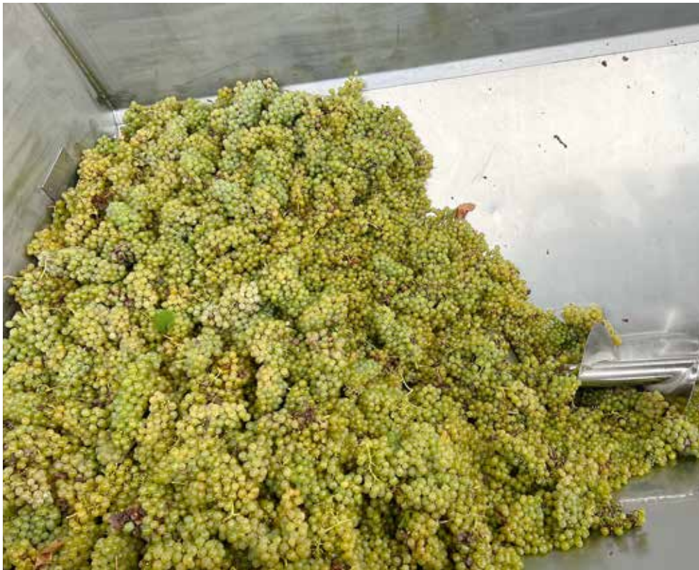
Trauben direkt vom Wümmet im Weingut Wiesendanger.