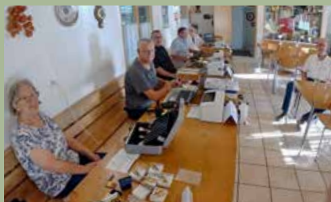
BS/BL Der Vorstand