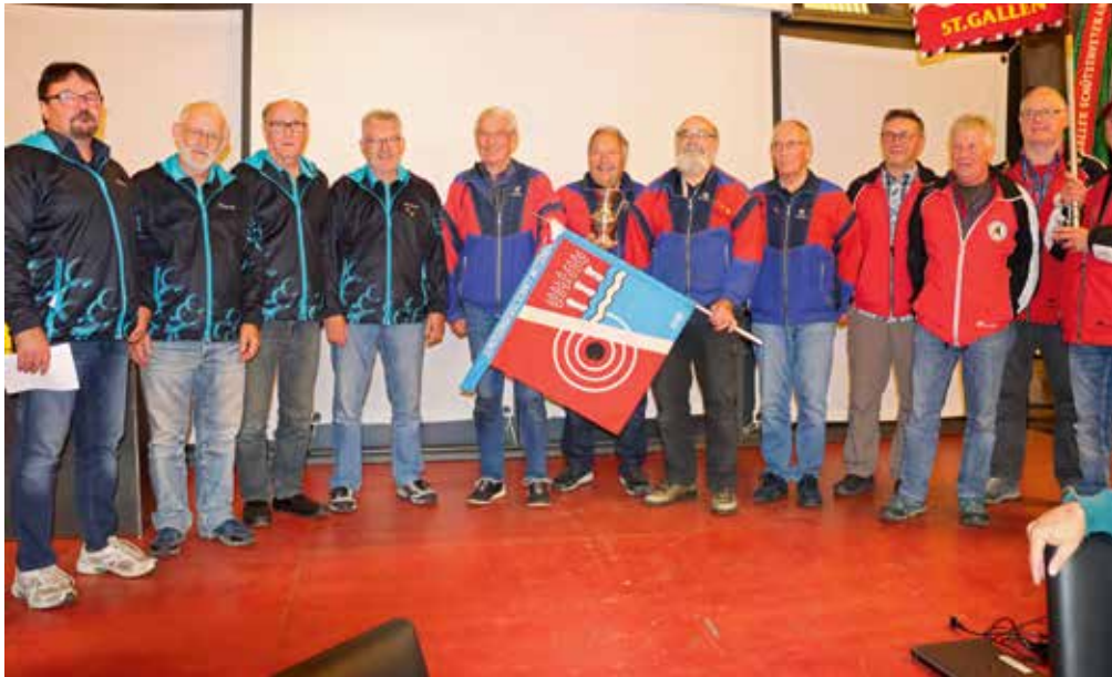
Übergabe des Wanderpokals an den Gruppensieger der Gewehrschützen aus Wittenbach v. li. 2. der MSV Oberrindal, 1. SG-Wittenbach und 3. die Schützen aus Balgach-Rebstein.

nung der Zuschläge ein Total von 551 Punkten ergab. Den zweiten Rang belegte die Pistolengruppe von Sargans 550 Punkten gefolgt von den Pistolenschützen Liechtenstein mit nur 4 Punkten weniger.