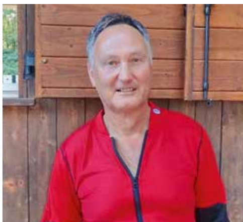
Sieger in der Einzelkonkurrenz 300 m Kat. A

161 Schützinnen und Schützen nahmen am Jahresschiessen teil (2022: 165), wobei der Rückgang der Teilnehmerzahl die Distanz 50m betraf. Das konstant schöne und warme Sommer-