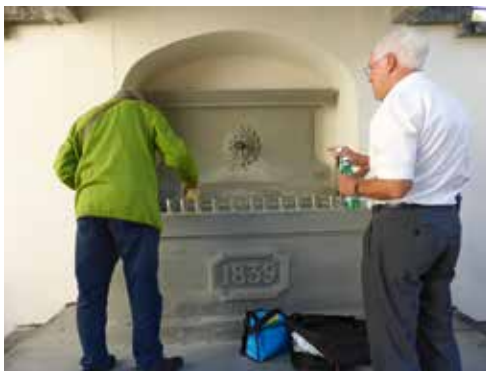
Ausschank des Apéros.