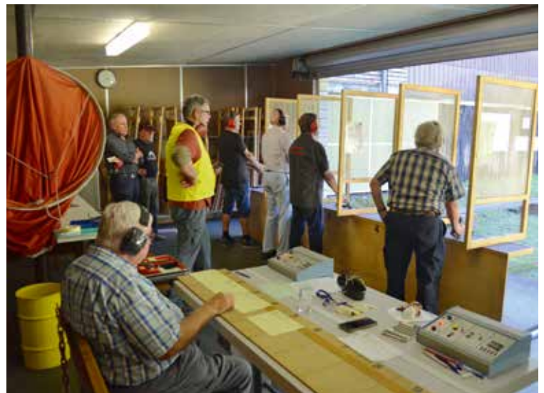
Schiessbetrieb Pistole 25m in Hergiswil, Teufmoos