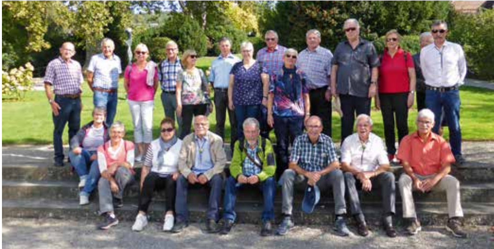
Gruppenbild mit allen Teilnehmern.