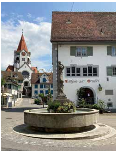
Rathausplatz, Gasthaus zum Trauben, Gründungslokal TVSV.

Nach der Begrüssung durch die Präsidenten Markus Brandes und Fredy Züger und einer Koffeinstärkung ging es auf einen «Brunnenspaziergang».