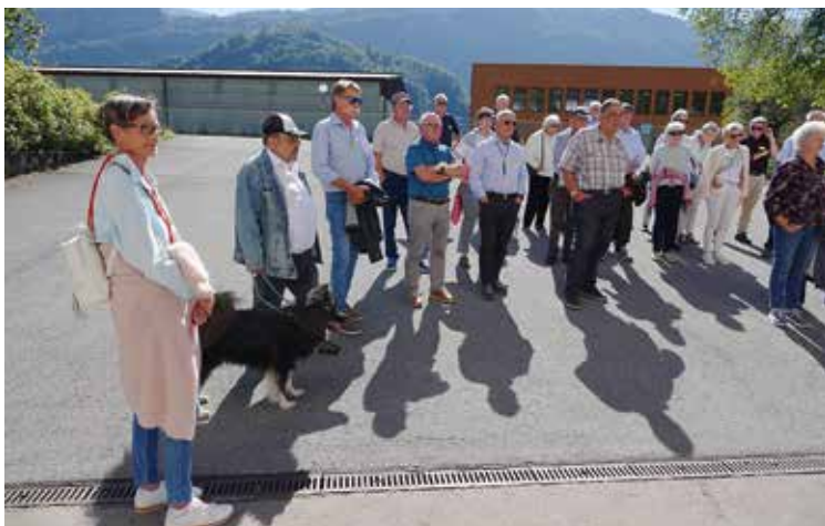
Ca. 40 Schützenveteranen mit ihren Partnerinnen lauschen der Ausführungen vor dem Waffenmuseum.