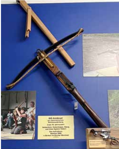
SIG Armbrust Ende 19. Jahrhundert