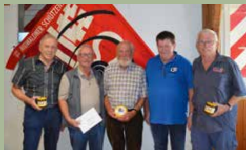
NW Sieger des Jahresschiessen 10