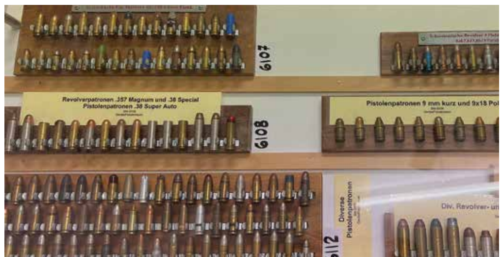
Revolver- und Pistolenpatronen aller Kaliber

Die Firma wurde 1853 als Waggonfabrik gegründet. Es handelte sich dabei um ein Industrieunternehmen, das gleich mit 150 Mitarbeitern ins Geschäft einstieg. Josef Hugentobler von der SIG Historischen Waffensamm-