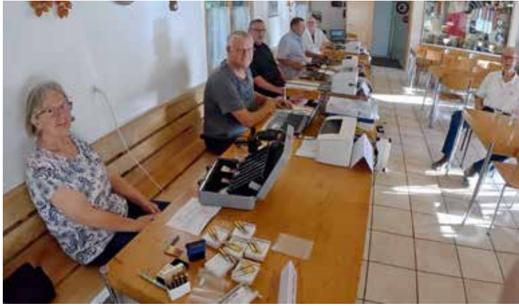
Vorstand der Schützenveteranen BL/BS