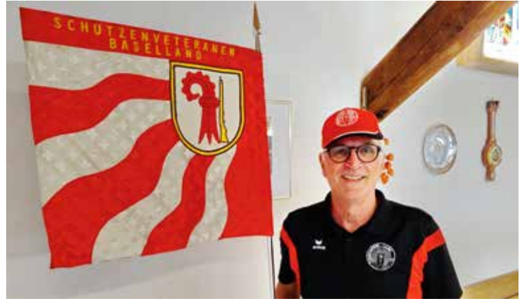
Sieger in der Einzelkonkurrenz 25 m Kat. E