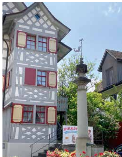
Farbbrunnen beim Eigenhof.

Weinfelden ist bekannt für seine Brunnen und der Thurgauer Präsident liess es sich nicht nehmen, die Gruppe, vor allem die Schwyzer Gäste in die Geheimnisse der «Wasserspender» einzuweihen. Die Technischen Betriebe Weinfelden AG (TBW) sorgen in allen Weinfelder Haushalten für sauberes Trinkwasser. Dieses sprudelt auch in 35 Weinfelder Brunnen, die von der TBW unterhalten werden. Die Weinfelder Brunnen haben eine lange Geschichte. Jahrhundertlang übernahm