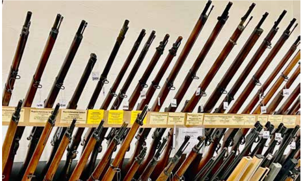
Zahlreiche Gewehre aller Art.