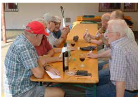
Wichtiger als die Resultate – die Pflege der Kameradschaft.

nenberg, auf dem dritten Rang – beide Schützen wiesen das gleiche Resultat (380) auf.