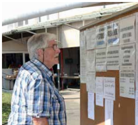
Informationen waren auch beim Veteranenschiesen wichtig.