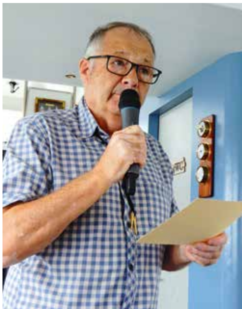
Präsident Ruedi Ryf bei der Begrüssung

teilzunehmen und dabei das Kranzresultat zu erzielen. Beim anschliessenden kameradschaftlichen Zusammensein in der Schützenstube fand der Schiessabend seinen Ausklang.