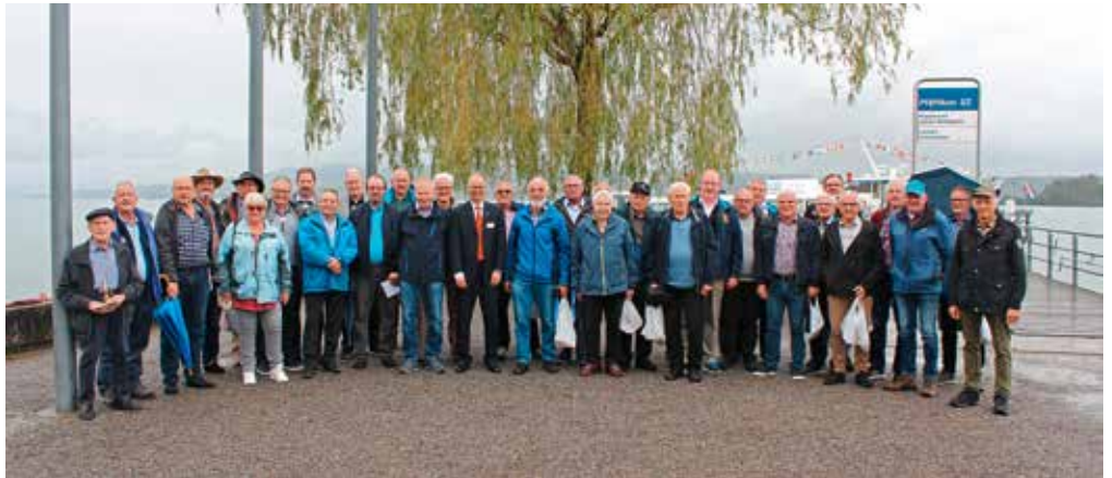
Gesamtfoto der Festgemeinde