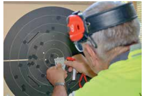
Bei Gabenstich wurden die Schusswerte auf die Hunderter-scheibe genau ermittelt.