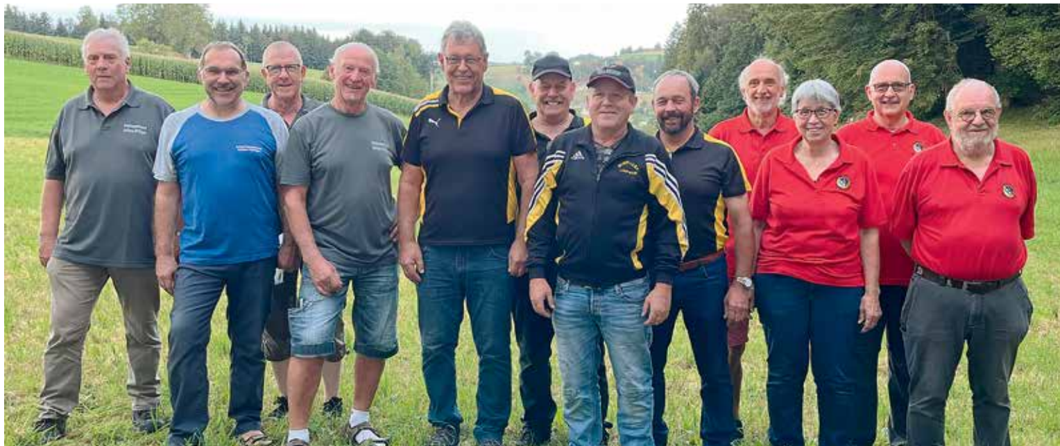
Links die Gruppe «Flodur, SG Aefligen-Rüdtligen, in der Mitte die Gruppe «Limpach 1» der SG Limpach und rechts die Gruppe «Erlinsburg» der Juraschützen Niederbipp.