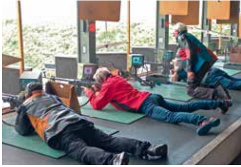
Einblick in den Schiessbetrieb

in Zukunft problemlos Schiessplätze finden lassen um diesen und ähnliche Anlässe organisieren und durchführen zu können. Die Ranglisten sind wie immer unter www.glarner-schuetzen.ch/veteranen abrufbar.