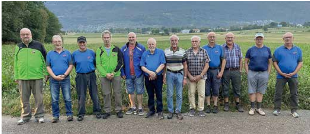
V.l.n.r.: 3. Rang, Gruppe «Läderchittu», Dieterswil Moosaffoltern; 1. Rang, Gruppe «Linde», Feldschützen Merzligen; 2. Rang, Gruppe «Nume Luege», Dieterswil Moosaffoltern

3. Rang mit 749 Punkten Gruppe «Läderchittu», Dieterswil Moosaffol-