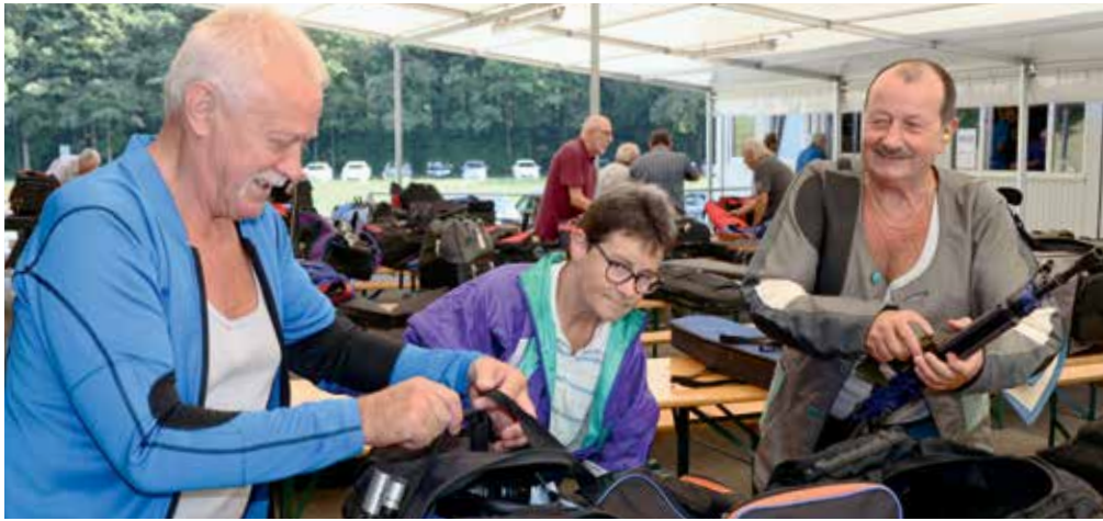
Im Materialzelt bereiteten sich Schützinnen und Schützen vor.