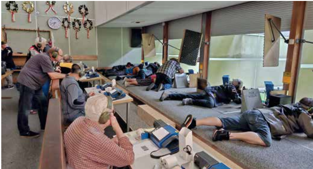
Die Veteranen beim Jubiläumsschiessen

jetzigen und auch alle früheren Mitglieder, das Höfner-Verbandsschiff bis heute erfolgreich auf Kurs gehalten hätten. Er wünsche dem jüngsten Unterverband im Kanton für die Zukunft weiterhin viel Wohlergehen.