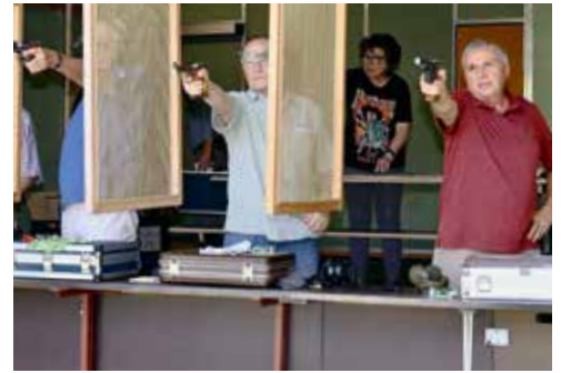
Einblick in den 25-m-Stand