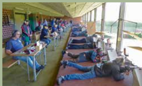
AG Reger Betrieb im Schiessstand 7