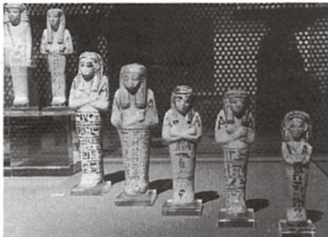
Bild: Totenfiguren von verschiedenen Privatsammlern.

Über 300 altägyptische Kunstobjekte aus Schweizer Privatbesitz zeigt die Sonderausstellung «Ägypten, Augenblicke der Ewigkeit» im Antikmuseum Basel. Rund 230 davon sind erstmals öffentlich zu sehen. Gezeigt werden zahlreiche Skulpturen aus Stein, Bronze und Ton, Gebrauchskeramik, Kultgefäße, Reliefs mit bildlichen Darstellungen und Hieroglyphen, Malereien, Sarkophage und Mumienmasken. Die Ausstellung über vier Jahrtausende ägyptischer Kunst wird in Basel bis 13. Juli gezeigt, später ist sie auch in Genf zu bewundern.