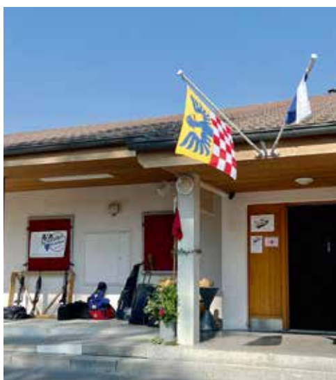
Ein schön geschmückter Eingang zum Schiessstand Witerig