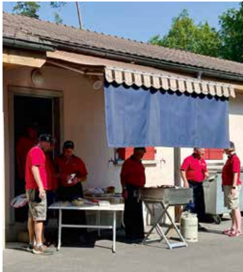
Eine feine Grillwurst darf nicht fehlen

Sieger war jedoch die Kameradschaft und das gemütliche Zusammensein der Schützenveteranen am Freundschaftsschiessen auf der Schiessanlage Witerig bei Hettlingen. Bei sommerlichem Schützenwetter war die Festwirtschaft immer gut besucht. Auch die Jasser konnten ihr Können voll nutzen – jedoch nach 2–3 Stunden jassen wurde an einigen Tischen abgerechnet mit dem Resultat dass keine Partei der Anderen etwas auszahlen musste. Medaillen oder Kranzkarten gab es wie alle Jahre kei-