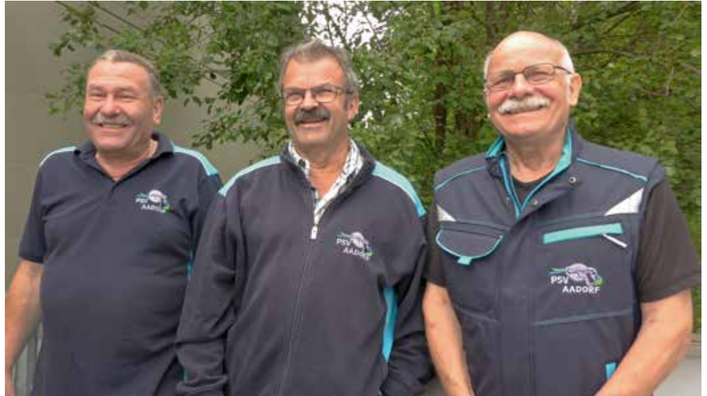
Gruppensieger 50 m Aadorf Gruppe 1