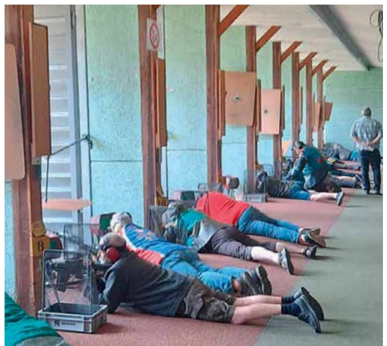
Schiessbetrieb in der 300 m-Anlage «Bannholz», Wiler bei Utzenstorf.