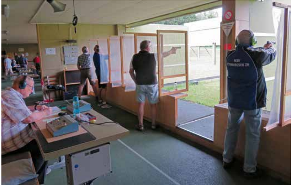
Genügend freie Plätze bei den Pistolen