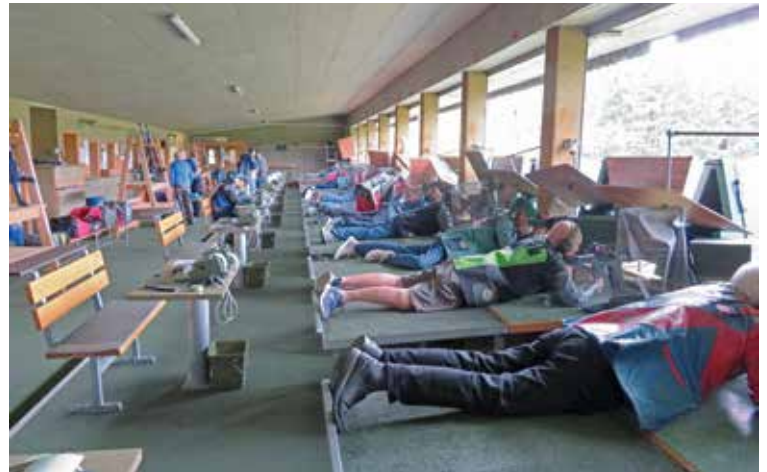
300 m, gute Beteiligung in der 2. Ablösung