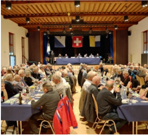
Der Saal im Hotel & Gasthof Hirschen in Hinwil mit den festlich geschmückten Tischreihen ist gut besetzt.