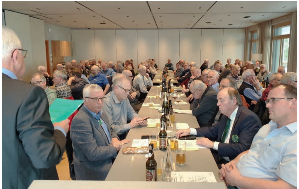
Gäste und Ehrenmitglieder