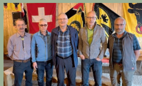
UR Die besten Urnerschützen 18