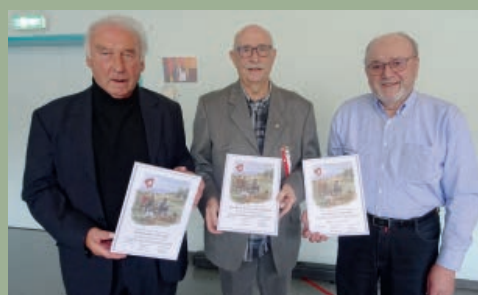
JU Ehreveteranen Jura 7