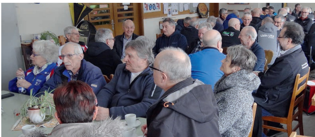
Kameradschaft wird bei den Veteranen gelebt.

Die Quali kationsranglisten in 10er-Wertung der beiden Au age Kategori-