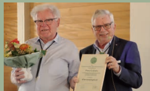
SG Neues Ehrenmitglied 11