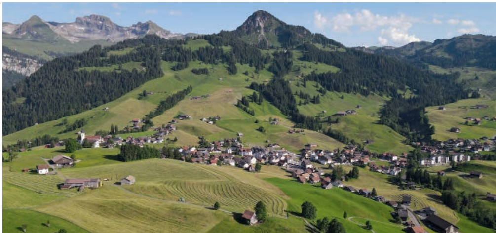
Oberiberg, höchstgelegene Schwyzer-Gemeinde – Der Tagungsort 2024

Der Verbandsvorstand des SVVS hat zusammen mit vielen Veteraninnen