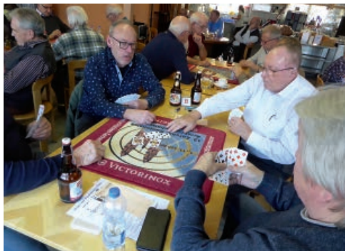
Der Kampf um die Punkte.