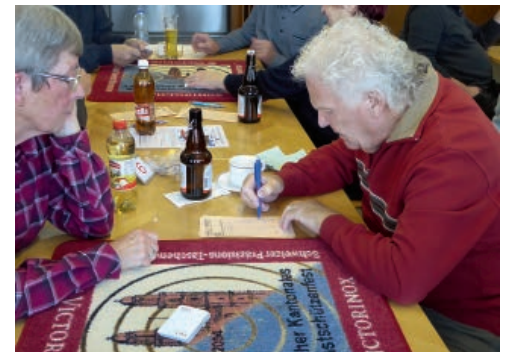
Das Total muss stimmen.