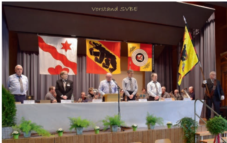
Vorstand Schützenveteranen Bern-Emmental SVBE