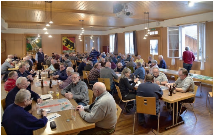
Saal vom Gasthof «Zum Sternen», Neumühle, Zollbrück