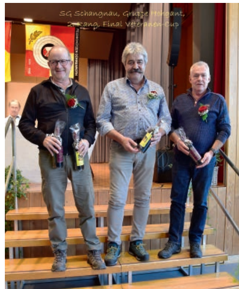
SG Schangnau, Gruppe Hohgant, 2. Rang Kant. Final Veteranen-Cup