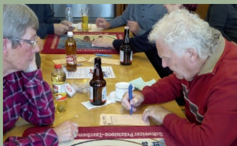
AR Das Total muss stimmen 6