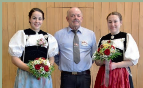
BE Neuer Präsident SVBE 7