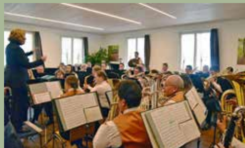
BE Musikgesellschaft Rüderswil 7