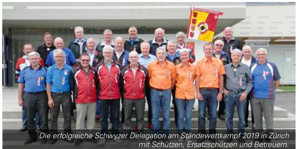
Die erfolgreiche Schwyzer Delegation am Ständewettkampf 2019 in Zürich mit Schützen, Ersatzschützen und Betreuern.

Zum Abschluss des «Eidgenössischen» findet am Samstag, 31. August, der Ständewettkampf mit Gewehr 300 m