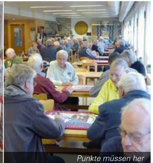
Punkte müssen her

ner Bargabe und ein herrlich munden- des Bauernbrot abgegeben werden.