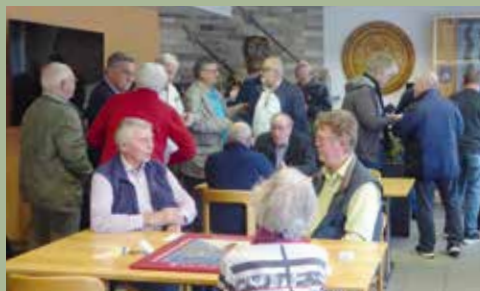
AG Warten auf den Jass-Startschuss 6