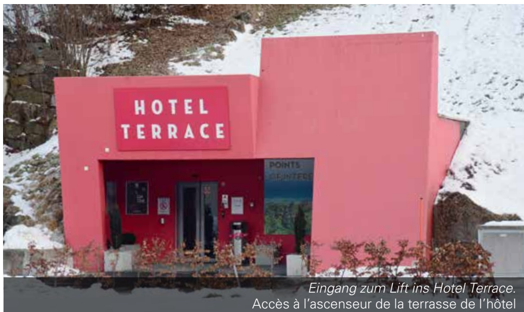
Eingang zum Lift ins Hotel Terrace. Accès à l'ascenseur de la terrasse de l'hôtel

Engelberg est une ville alpine située en Suisse centrale. Son monastère datant du 12 e siècle se trouve au centre de la ville. Des sentiers de randonnée permettent d'accéder au Titlis et à ses pistes de ski qui descendent en zigzag. Le premier téléphérique rotatif du monde TITLIS Rotair mène au sommet, au pont suspendu TITLIS Cliff