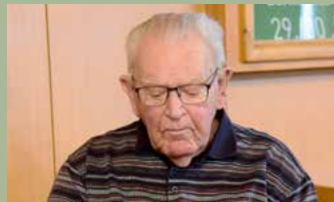
BE Der älteste Jasser in Zollbrück 8