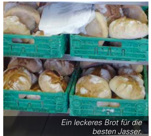
Ein leckeres Brot für die besten Jasser.

Zum Eintragen in die Agenda: Der nächste Jass findet am Freitag, 12. Januar 2024, in der Schützenstube der