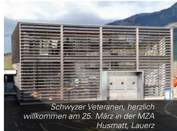
Schwyzer Veteranen, herzlich willkommen am 25. März in der MZA Husmatt, Lauerz