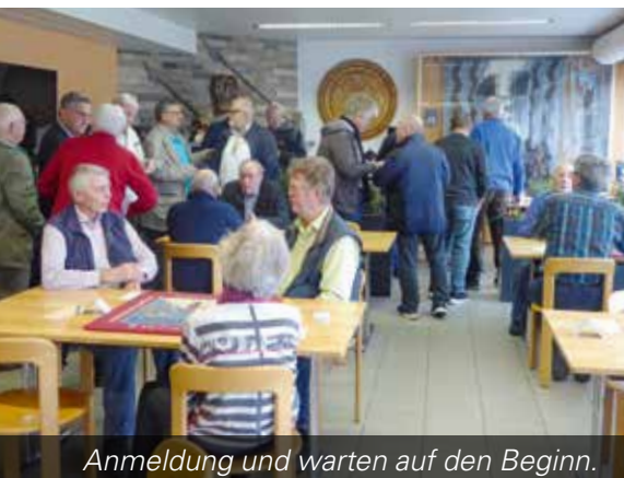
Anmeldung und warten auf den Beginn.